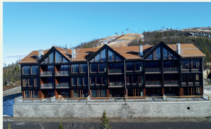
Bygg A i The Edge inneholder 15 leiligheter.

området, som ligger cirka 1.000 meter over havet, har utviklet seg i nyere tid.