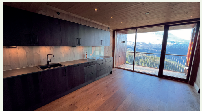
Utbyggerne har lagt seg på en høy standard.

– Vi har valgt solide og varige produkter med god design. Det