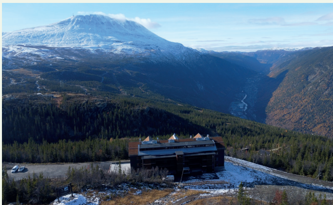
Det nye leilighetsbygget ligger like i nærheten av Gaustablikk ved foten av, og med utsikt mot, Gaustatoppen.