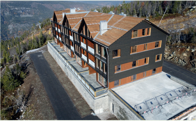
Husene er på fire etasjer, inkludert en underetasje.