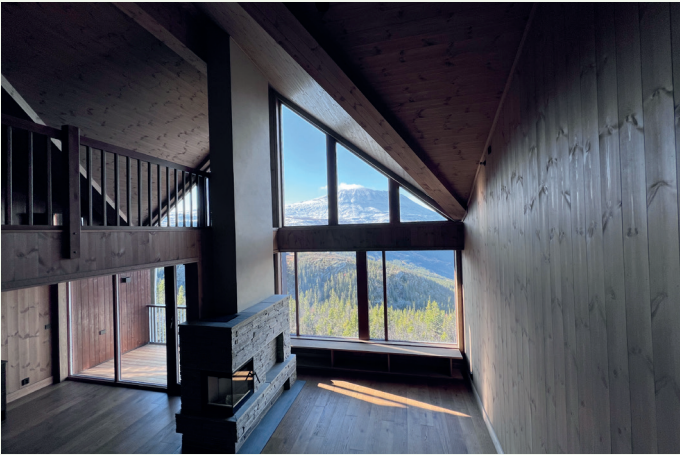
Leilighetene varierer i størrelse fra 76 til 176 kvadratmeter.