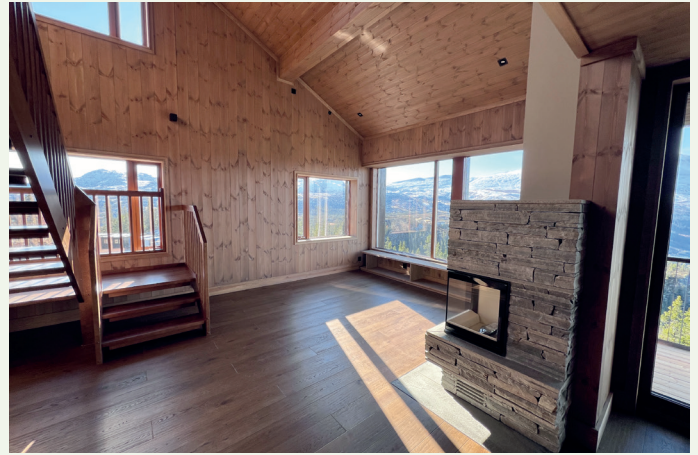
Leilighetene har murte peiser.

Det første huset ligger helt innerst i veien, og har dermed en populær beliggenhet. Samlet er det et boareal på 1.550 kvadratmeter i bygget.