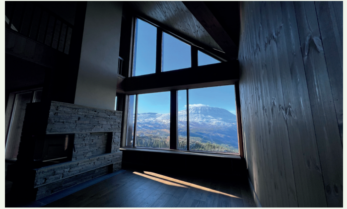
Utsikt mot Gaustatoppen fra en av leilighetene.

bruksopplevelser, har gjort at man har lyktes så godt.